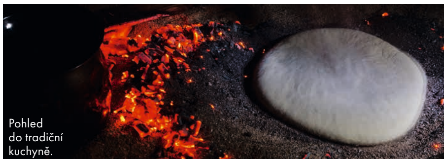
Pohled do tradiční kuchyně.

A na samém vrcholku, kam se šplháme přes vratké balvany, jsou lidské postavy s kulatými hlavami. Takové, jaké Dänikena inspirovaly k teoriím o mimozemšťanech. Prehistorických rytin a maleb je v celé oblasti Hoggaru spousta. Bohužel jsou často poničeny islamisty, mají odsekané celé hlavy. A objevily se i případy, že byl odseknut celý kus kamene a rytina putovala do soukromého sbírky.