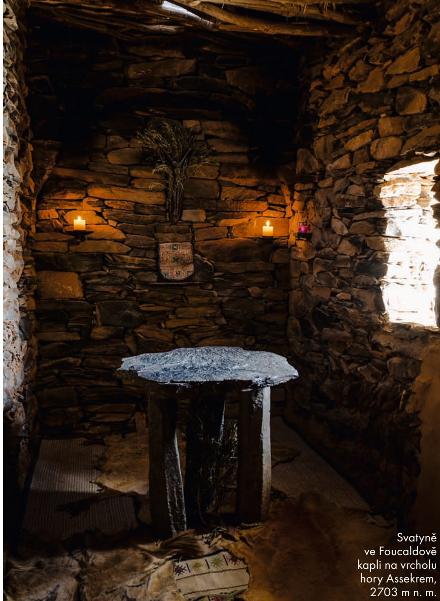
Svatyně ve Foucaldově kapli na vrcholu hory Assekrem, 2703 m n. m.

Silným zvykem, čehož si všimne každý cestovatel, kterého provázejí Tuaregové je, že drží polední siestu. Přes polední spánek nejede vlak, je posvátný a neoddiskutovatelný. Jejich zajímavým rysem je též udržování pořádku. Nejen naši průvodci všechny odpadky spalovali, ale i kolem tuaregských vesnic je na rozdíl od arabských čisto. Po dalším putování lávovými poli, místy protkanými vyschlými řečišti s akáciemi a pasoucími se velbloudy, přijíždíme ke skále s prehistorickými rytinami. Vytvořili je obyvatelé Sahary asi před 10 000 lety a jsou i v sousedních pohořích Tassili a Acacus. Rytiny jsou důkazem, že Sahara byla v té době zelená a plná zvířet. Nejvíce mě zaujal slon v pohybu. Naprosto stejná, jen větší a zrcadlově obrácená rytina je v pohoří Acacus v Libyi. Oba sloni mají nakročeno a prehistorický autor vytvořil velmi dynamický dojem. Jen se obávám, že s ohledem na téměř válečný stav už ani jednoho z těchto slonů nikdy neuvidím. Na skalním útesu jsou další obrázky – žirafy, buvoli, koně, gazely, krávy.